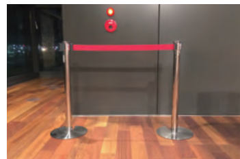
立入禁止チェーン(20本)