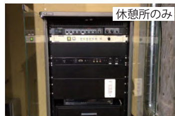
音響・映像設備(1セット) ※有線マイク含む