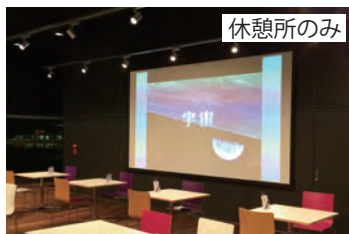
大型スクリーン(1セット) ※プロジェクター含む