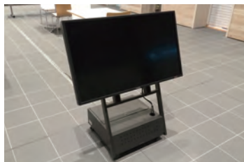
展示用モニター 42型(2台) ※ブルーレイレコーダー含む